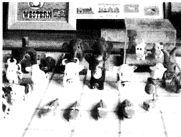
第9回顕彰論文応募作品より

この事業は〈社会福祉法人 社会福祉事業研究開発基金〉より助成をいただき実施いたします。