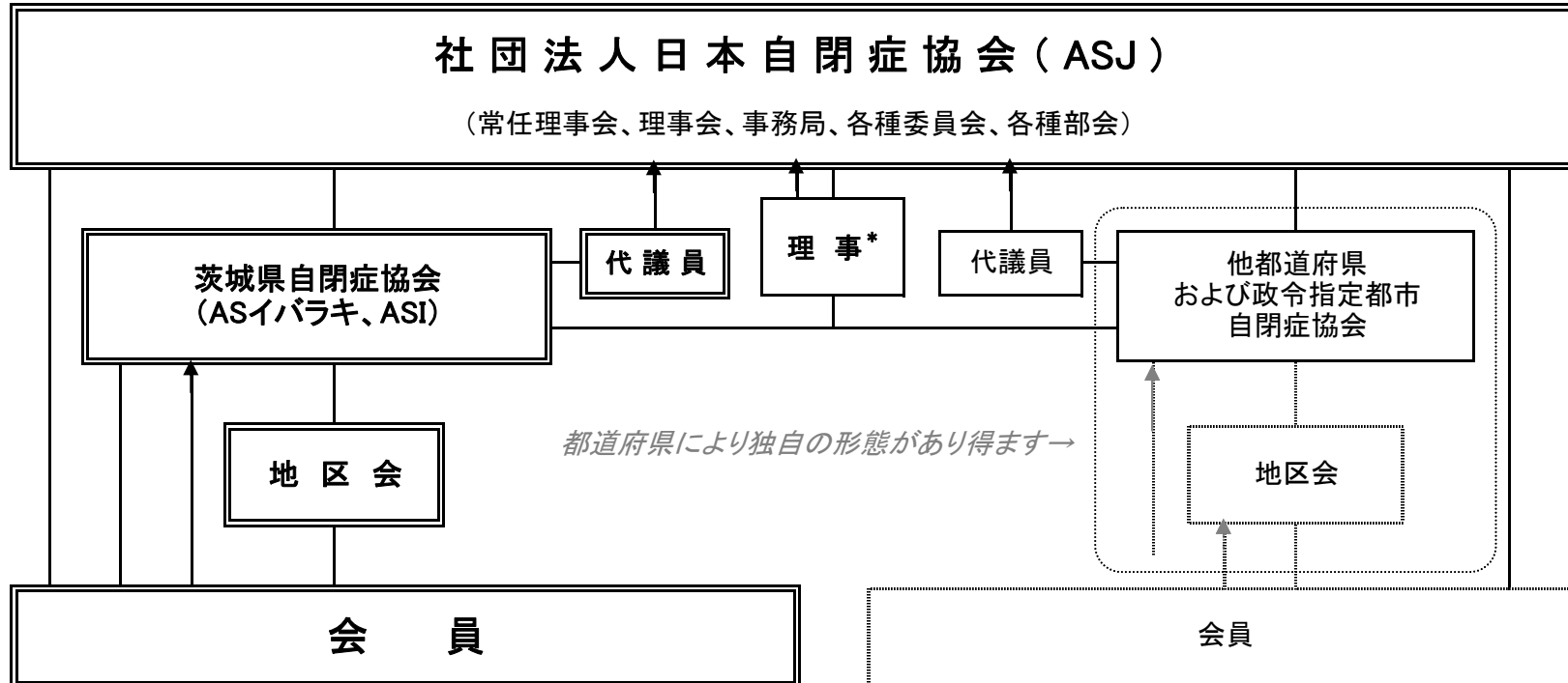
社団法人日本自閉症協会の概略組織図(平成20年4月1日施行定款による)